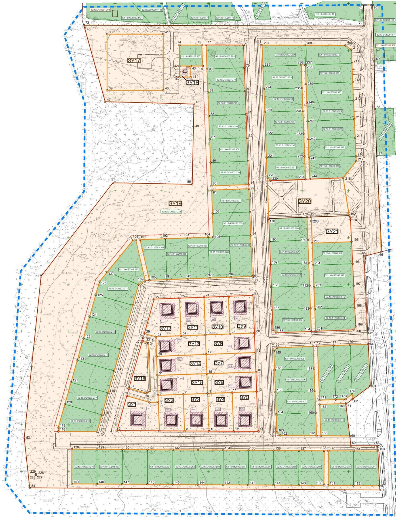
Экспликация зон планируемого размещения объектов капитального строительства