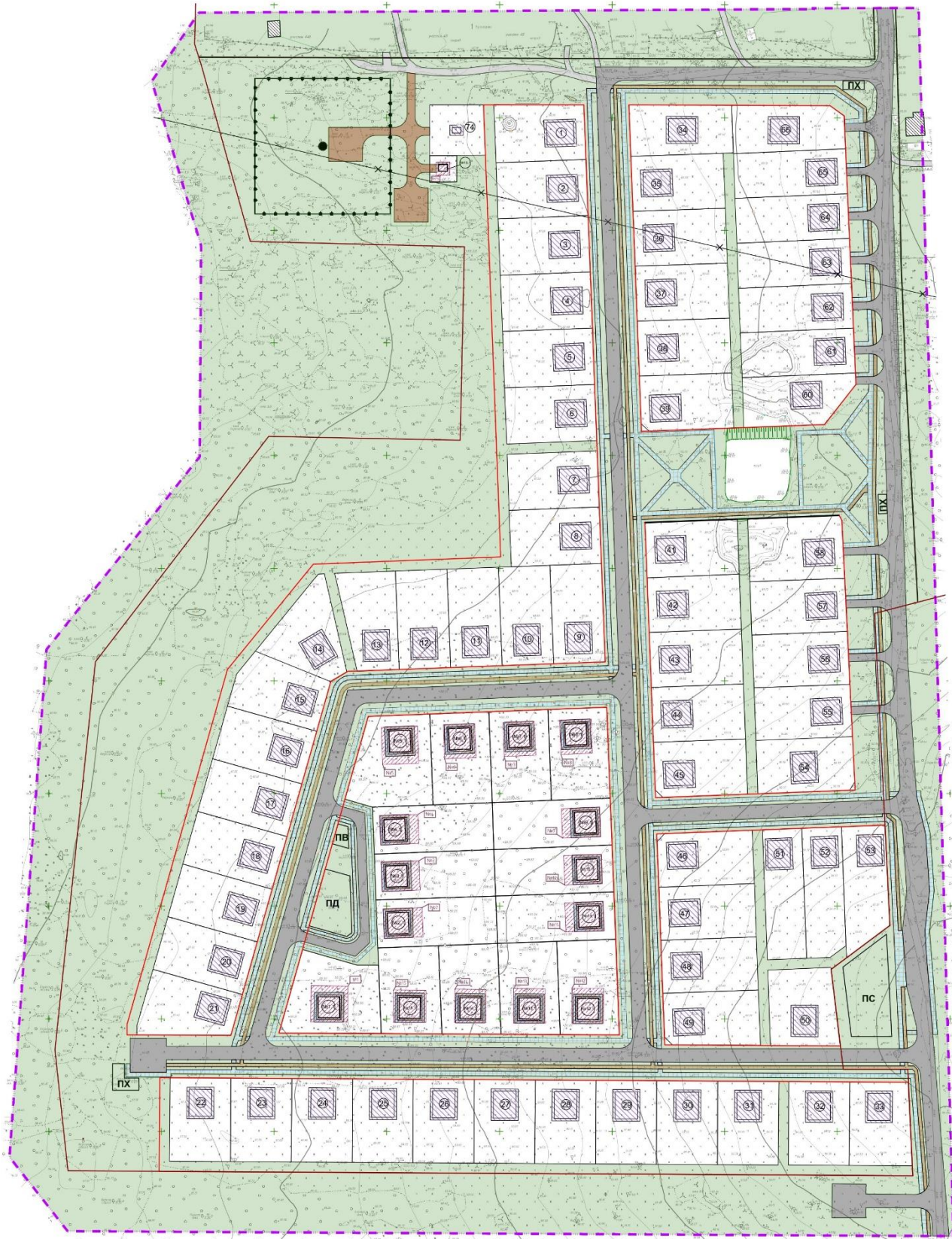
Экспликация зон планируемого размещения объектов капитального строительства